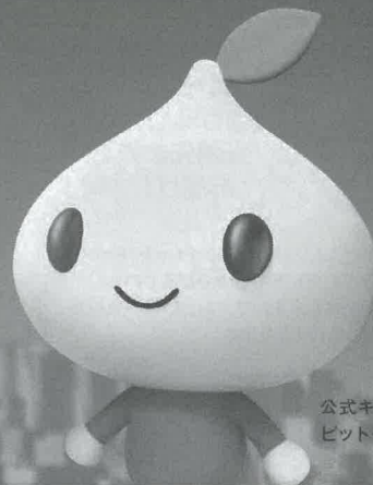
公式キャラクター ビットくん

「みんなでたすけあい、豊かで安心できる社会」の実現に向け、 皆さまとともに取り組んでいきます。